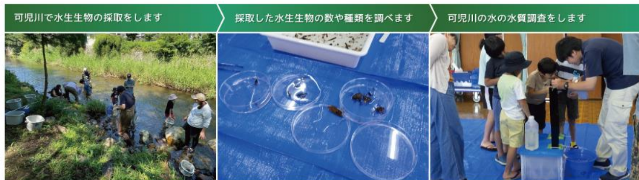
可児川で水生生物の採取をします