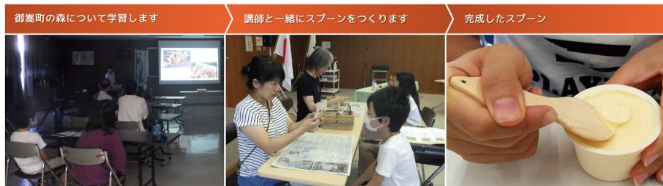
御嵩町の森について学習します